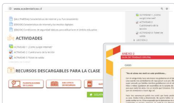
● Plataforma del Programa

Sabemos que para los adultos que no crecieron con la tecnología este tema es más difícil y requieren un poco más de apoyo. Por suerte entonces, estamos aquí para ayudarles.