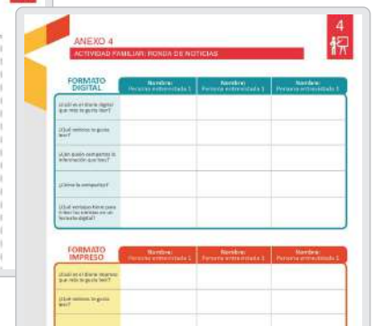
● Actividad Inicial