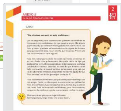
● Actividades Grupales